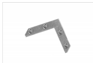
Lockset Simple Large Single Plate FK-0214