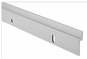
Cleathanger 20 FK-8020