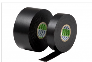
Nitto tape FK-8815