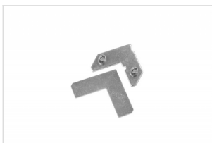
Lockset simple with allen key FK-0218