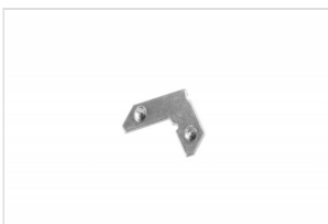
Lockset Simple Single Plate FK-0212