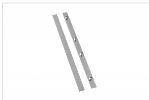
Extension Set Eco/Simple FK-0510