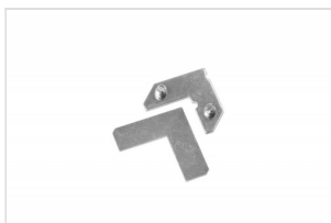
Lockset Simple FK-0210